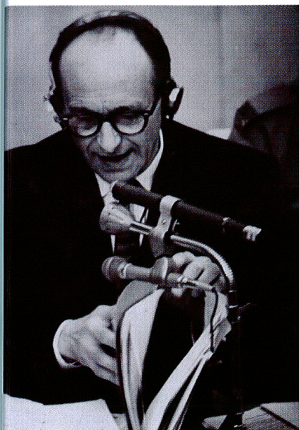
→ Adolf Eichmann, durant les audiences de son procès à Jérusalem, en 1961.