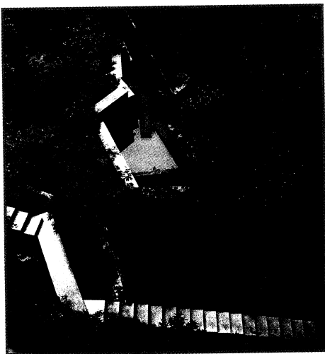
Jardiniers d'avant-garde, éd. Actes Sud. Michael Van Valkenburgh, Garden on Turtle Creek, Dallas.

Abondamment illustrée de photographies et de quelques plans, cette sélection