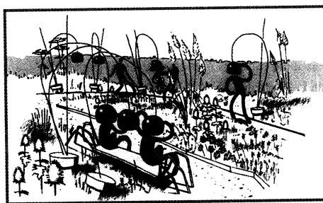
Jardins de couleur, éd. Gourcuff Gradenigo. Le jardin Mange-Tête de © S. Fuhrman, S. Lacoste et L. Pinsard, P. Maillols.

Festival international des jardins 2009. Domaine de Chaumont-sur-Loire, Centre d'arts et de nature Dir. Chantal Colleu-Dumond