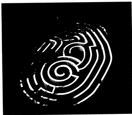
Le Jardin comme labyrinthe du monde, éd. Musée du Louvre / Presses de l'université Paris-Sorbonne. Michael Ayrton, Dédale, Arkville.

Un panorama pluridisciplinaire de l'association jardin-labyrinthe depuis l'Antiquité (traitée dans l'introduction) jusqu'à nos jours. Les études, toutes illustrées, abordent la portée symbolique, les filiations formelles, les usages et les interprétations des dédales et labyrinthes en Europe occidentale, principalement en France, mais aussi en Espagne, en Italie et aux Pays-Bas. Riche bibliographie en fin d'ouvrage.